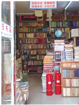
书店里摆满了旧书