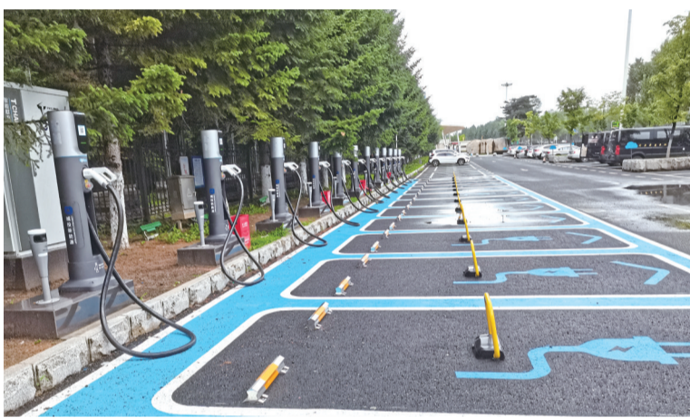
已经投入使用的充电桩

随后,记者在长春市公共资源交易网上了解到,今年,长春市内的各个区域将新建3000个充电桩,这一举措也将让所有新能源车车主提升使用感。本次新建的充电桩主要包括建设安装充电桩3000个,其中快充