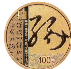
8克圆形精制金质纪念币背面图案

记者6月12日从中国人民银行获悉，人民银行将于6月27日发行中国书法艺术(草书)金银纪念币一套。该套金银纪念币共5枚，其中金质纪念币1枚，银质纪念币4枚，均为中华人民共和国法定货币。