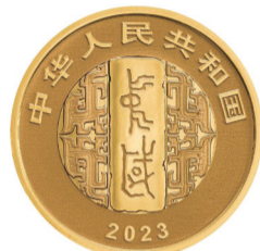
8克圆形精制金质纪念币正面图案