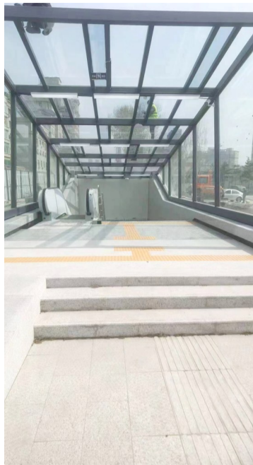
十一高人行过街通道