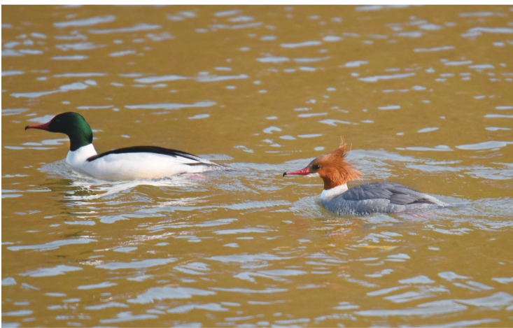
秋沙鸭有着“杀马特”头型

不远处的秋沙鸭逆流而上,在众多水鸟中,“梳背头”的家伙很是惹眼,“杀马特”头型迎风招展,黑眼黑瞳宝石般闪亮,红红侧扁的长嘴,前端尖出长着黑色小钩,锋利的齿状喙和犀利的眼神。羽毛长得也颇具特色,雌雄都有一头“杀马特”发型,雄鸭羽毛黑白分明,头部黑色,身体白色,背部一道黑色直通尾部。雌鸭羽毛以棕褐色、灰色为主,棕褐色的头部,灰色的背,下面也长有白色羽毛,脖颈处由白向灰逐渐过渡。