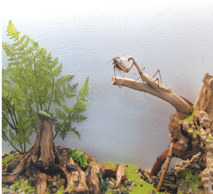
“螳螂捕蝉”生态情景模拟

虫,各种标本则向人们展示着琳琅满目的新奇世界。其中“闪蝶”标本最为瞩目,数十只发出闪闪蓝光的蝴蝶美丽惊艳,光彩迷人,优美华丽。