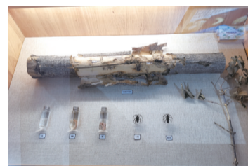
园林植物病虫害展区