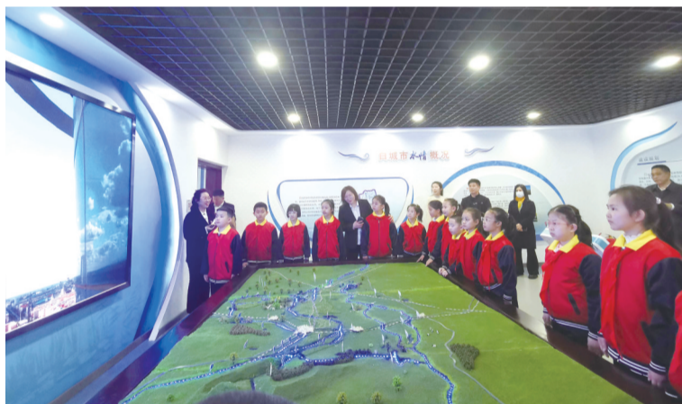
学生们参观学习

同学们在讲解员的引导下,参观了节水科普馆的各个板块,听取了节水知识宣讲,参与了节水知识互动。活动中大家认真倾听,相互讨论,不时提出问题,各个热情高涨。参观结束后,同学们纷纷表示,通过参观学习,进一步认识到了水资源的重要性,了