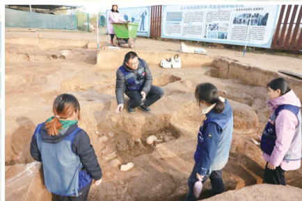
吉大师生在师村遗址考古发掘现场