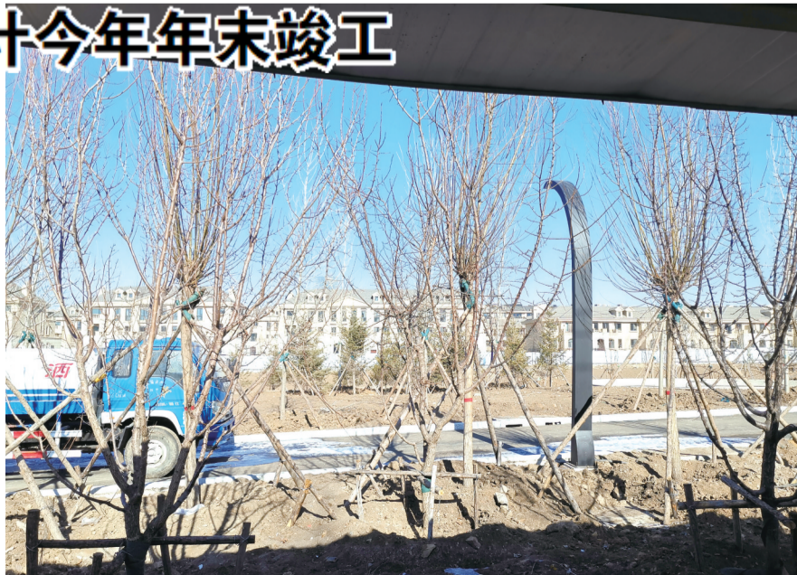
公园部分区域园路已经修好