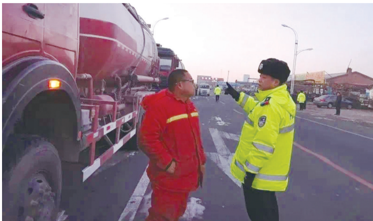
执勤交警紧盯“两客一危一货一面”等重点车辆

会议强调,要按照全省冬季公路交通安全整治行动总体部署要求,紧盯各类风险隐患,集中开展公路秩序净化、道路隐患整改、运输风险防范、交通安全宣传、依法追责整治等“五项攻坚”。要启动高等级勤务,最大限度把警力和装备摆到路面,有效提升执法管控效能。紧盯“两客一危一货一面”等重点车辆,从严查处“三超一疲劳”等违法行