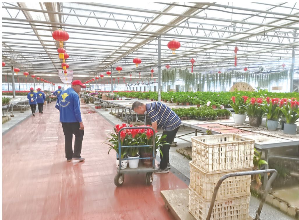
工作人员布展 本组图片 城市晚报全媒体记者 陆续 摄

8月18日,第二十一届中国长春国际农业·食品博览(交易)会(以下简称长春农博会)将正式开幕,此次农博会上有哪些好看好玩的东西呢?17日,城市晚报全媒体记者提前来到长春农博园,帮市民朋友们揭开本次农博会的“神秘面纱”!