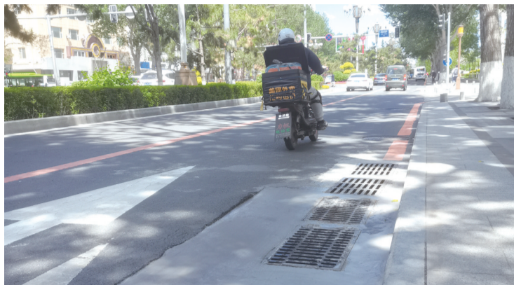
人民大街上新增雨水井

雨水井作为城市道路建设必备的设施之一,主要作用是用来排放雨水的。它的侧面有孔与排水管道相连,底部有向下延伸的渗水管,可将雨水向地下补充并使多余的雨水经排水管道排走。每年汛期来临时,强降雨都给长春市民的生活带来诸多麻烦,