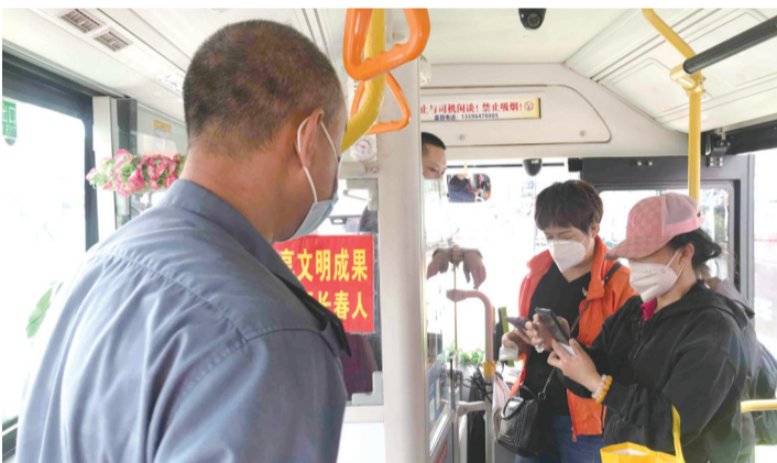
执法人员对公交车进行检查

长春市交通运输综合行政执法支队执法二大队执法人员尉昕野介绍,端午小长假即将来临,执法二大队做好公交服务保障和疫情防控两不误,要求轨道交通、城市公交企业严格执行行车作业计