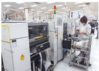
大陆汽车电子生产线

宽敞的车间内,自动化流水线按照预先设定的程序进行流转……过硬的高新技术,配套的硬件设施,大大提高了生产效率和产品质量水平。大陆汽车电子是国家级高新技术企业,也是世界500强公司德国大陆集团在长春的研发和生产基地。致力于车联网与架构、智慧出行、安全与动态控制等相关领域的汽车电子零部件的研发和生产,为一汽集团在内的国内各大整车制造企业提供安全、高效、智能且经济适用的汽车电子零部件,