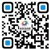
市民扫码“云”赏科技成果

省科技文献信息服务台(2022年吉林省科技活动周专题)www.jlstis.com