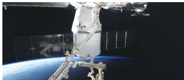
正在工作的空间机器人

5月22日,不少市民被吉林省科技文献信息服务台上展示的机器人内容吸引。这些机器人是协助人类探索太空的好助手——空间机器人。