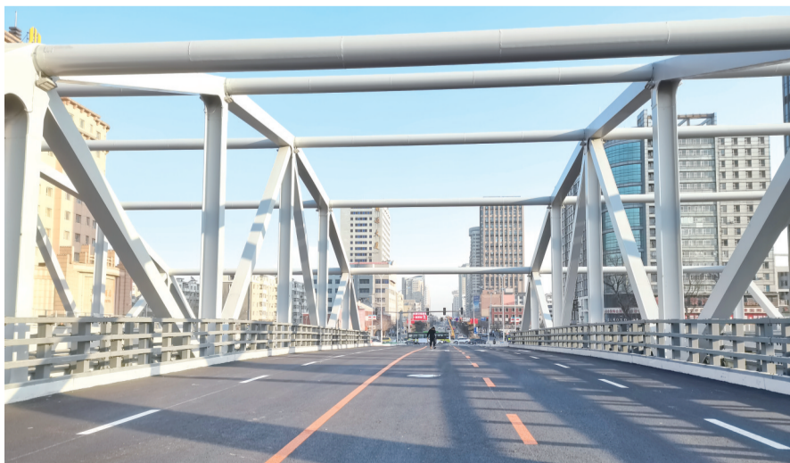
即将通车的长春市西安桥