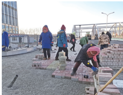
工人在桥的两侧铺设人行方砖

6月9日24时,长春西安桥改造工程正式开工建设。中铁十四局集团西安桥项目部全体参建人员紧紧围绕建设目标,充分发挥铁道兵精神,抽调精兵强将,采取切实有效措施,狠抓质量安全和进度控制,充分利用铁路窗口期,全力推进工程建设。该工程原计划2022年1月15日实现简易通车,为早日还路于民,全体建设者攻