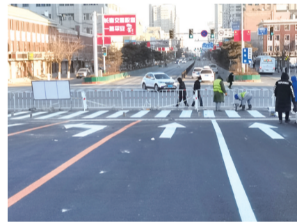
工作人员为通车做准备

坚克难、凝心聚力,抓紧一切时间追赶施工进度,在极寒天气下仍然坚守在施工一线。经过不懈努力,比原计划提前15天实现简易通车。