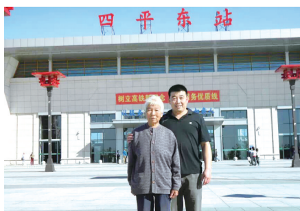
母亲生病前与儿子的合影