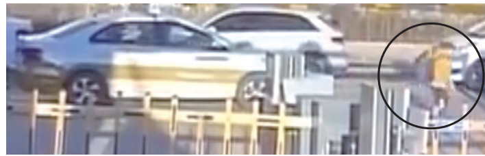
男孩站起后,出租车加速驶离现场