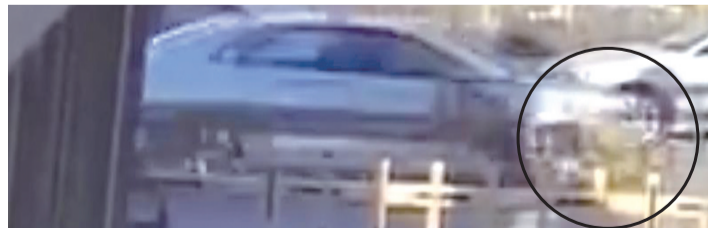
出租车将学生撞倒瞬间