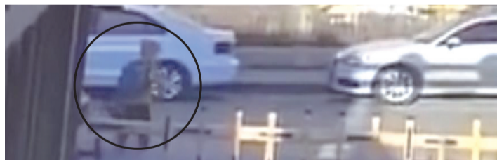
小学生背着书包站在地库出入口