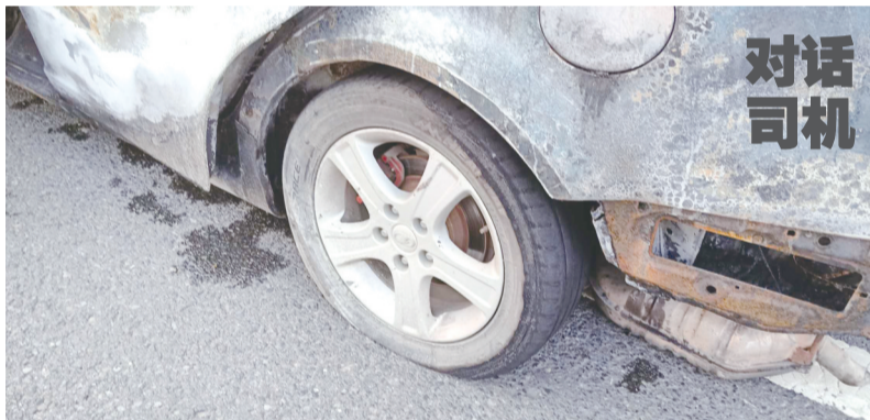
好险! 过火车的油箱安然无恙