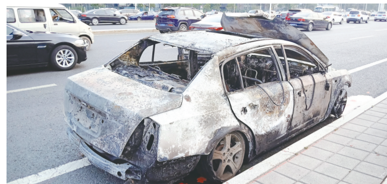
过火的车辆被拖出隧道