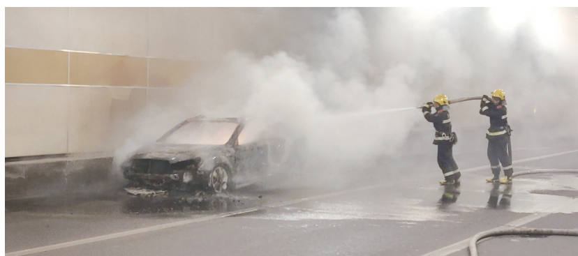
前来增援消防人员扑灭了明火