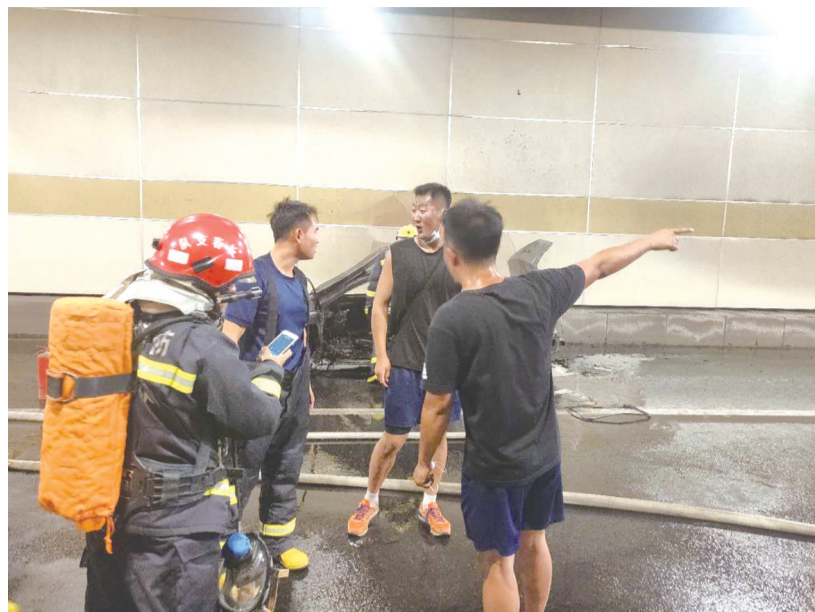
3个小伙伴向增援的战友介绍火情