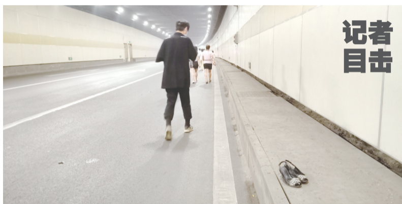
隧道路边放置着一双市民紧急疏散而下下的高跟鞋