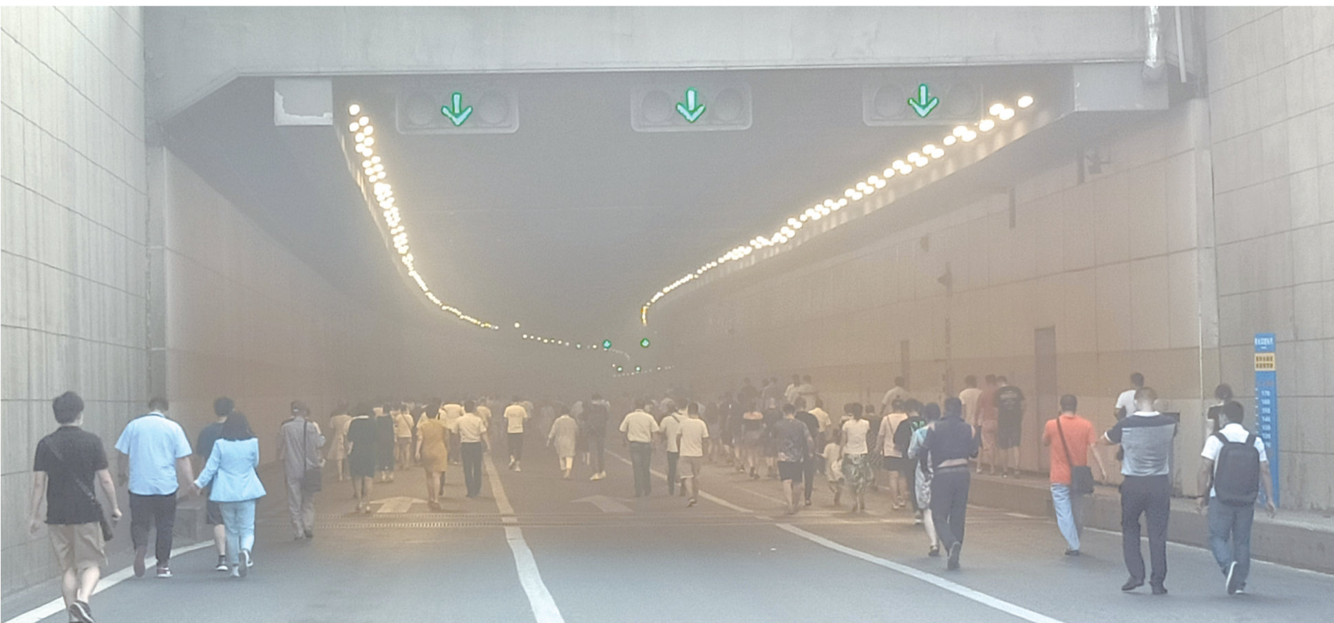
险情排除后,大家返回隧道取车