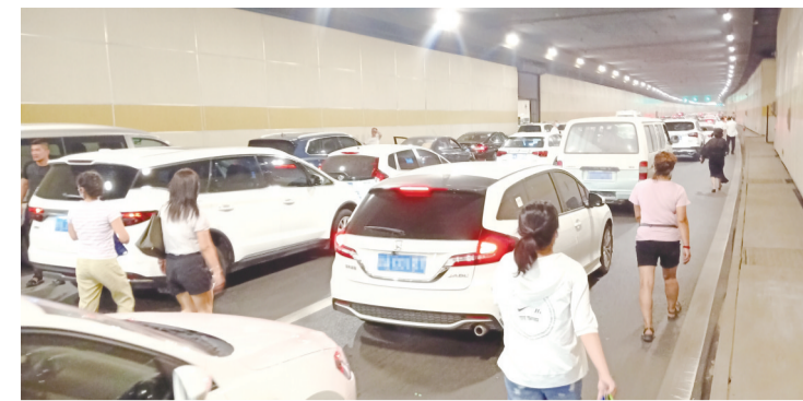
市民安全返回隧道