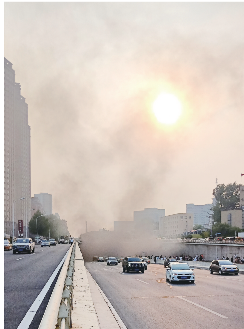
紧急疏散被困群众