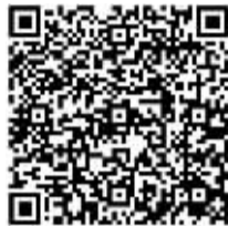
吉林省森林康养旅游项目操盘手实训营在线开营