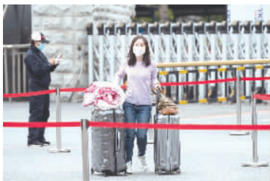
大包小裹来到校门