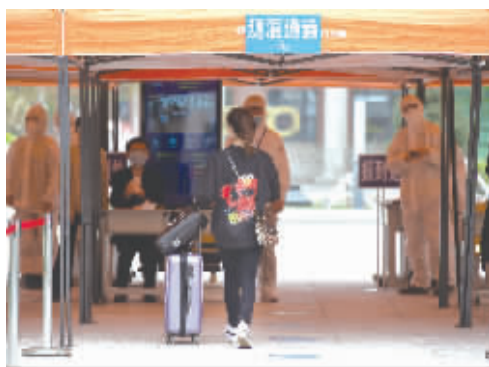
返校学生进入测温通道