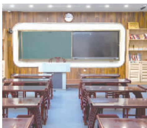
教室即将迎来“主人”