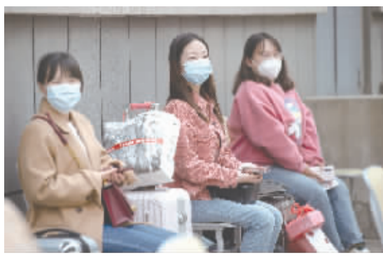
等待做核酸检测的同学