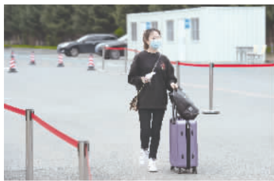
母校的气息越来越浓了