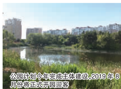
公园计划今年完成主体建设,2019年8月份将正式开园迎客