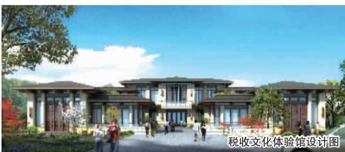
税收文化体验馆设计图