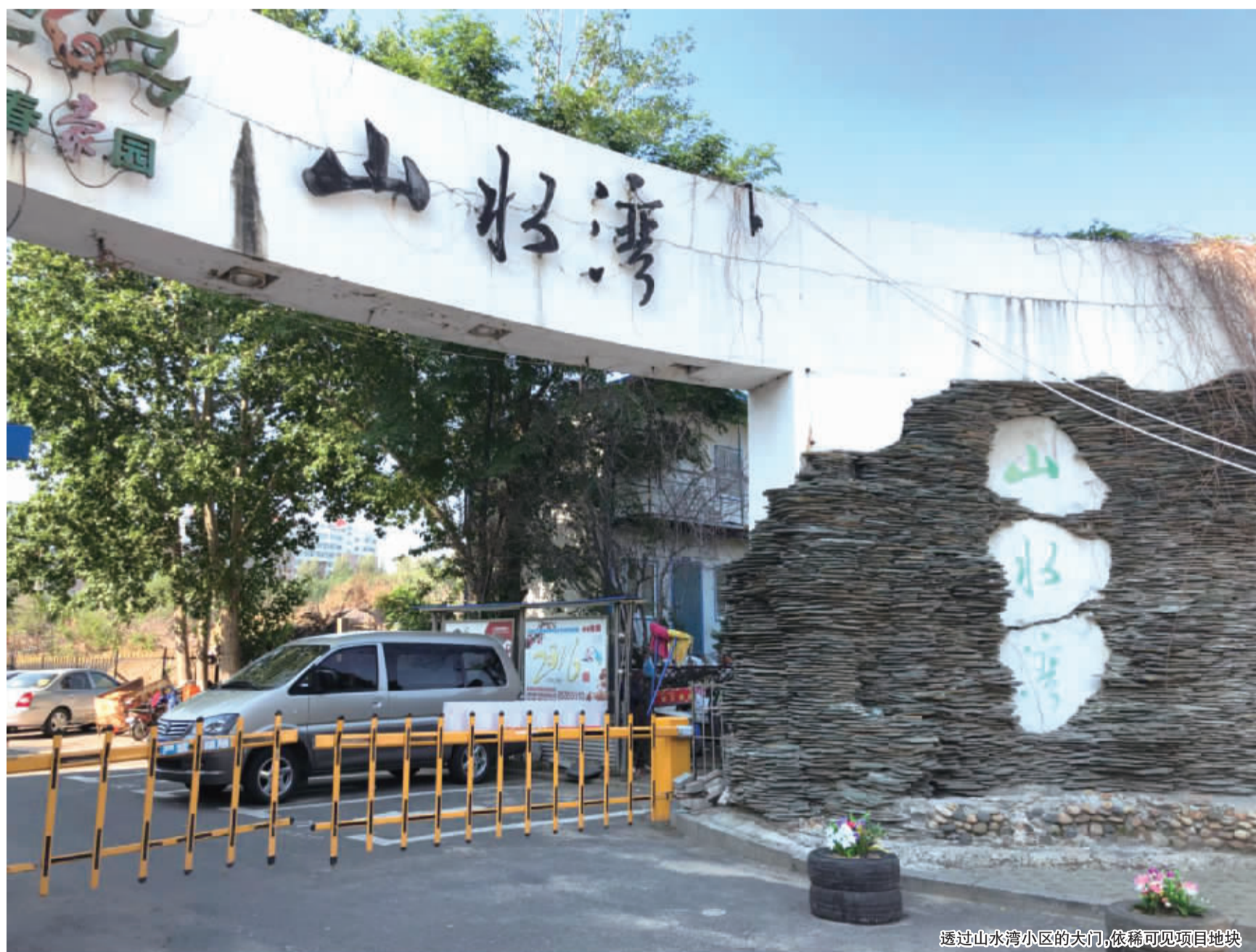
透过山水湾小区的关门,依稀可见项目地块