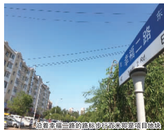
沿着幸福二路的标路步行百米即是项目地块