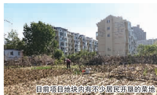
目前项目地块内有不少居民开垦的菜地