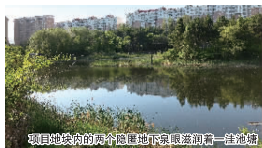
项目地块内的两个隐匿地下泉眼滋润着一洼池塘