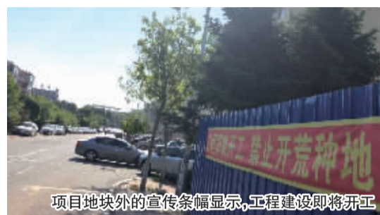
项目地块外的宣传条幅显示,工程建设即将开工