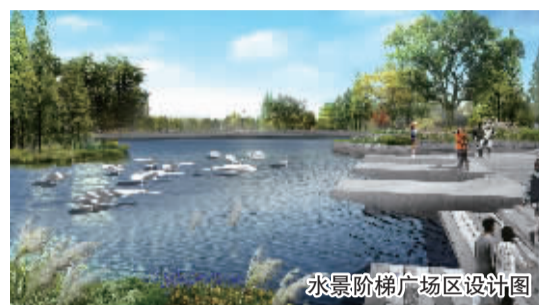
水景阶梯广场区设计图