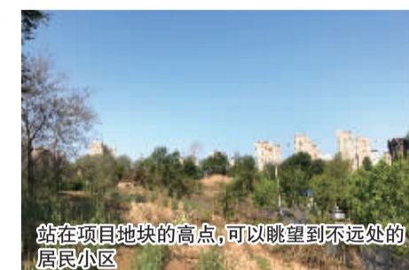
站在项目地块的高点,可以眺望到不远处的居民小区